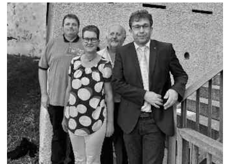
BM Burth mit den Ortsvorstehern

Die Stadt Aulendorf blickt mit Zuversicht und Erwartung auf die kommenden Jahre und dankt allen Beteiligten für ihren Einsatz und ihr Engagement.