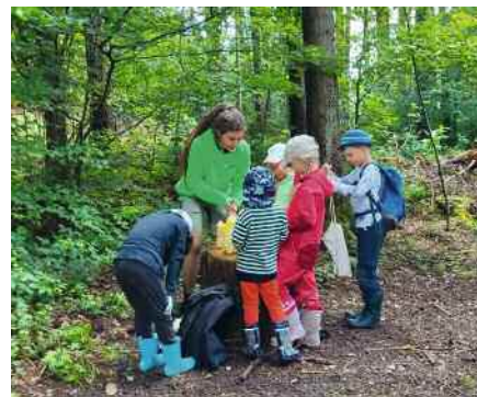
Die BUND-Naturkindergruppe bei der spielerischen Erforschung von Bäumen im Wald.

Informationen und Anmeldung erfolgt über BUND-Vorsitzenden: bruno.sing@bund.net oder 0173/6454673.