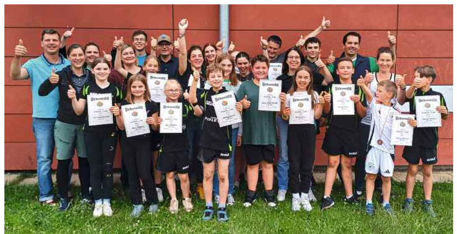
Family Cup: Sieger und Platzierte vom Family Cup