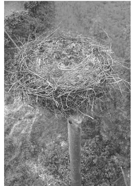
Die Störche haben das Nest in Münchenreute verlassen, weil die Jungstörche gestorben sind. Sie bauen ein neues Nest im Würzbühl.

Die BUND-Kindergruppe wollte die Beringung der Jungstörche in der Zollenreuter Straße miterleben. Auch Storchenspaten hatten sich gemeldet und waren dabei. Leider konnte dort der einzige Jungstorch nur leblos aus dem Nest geholt werden.