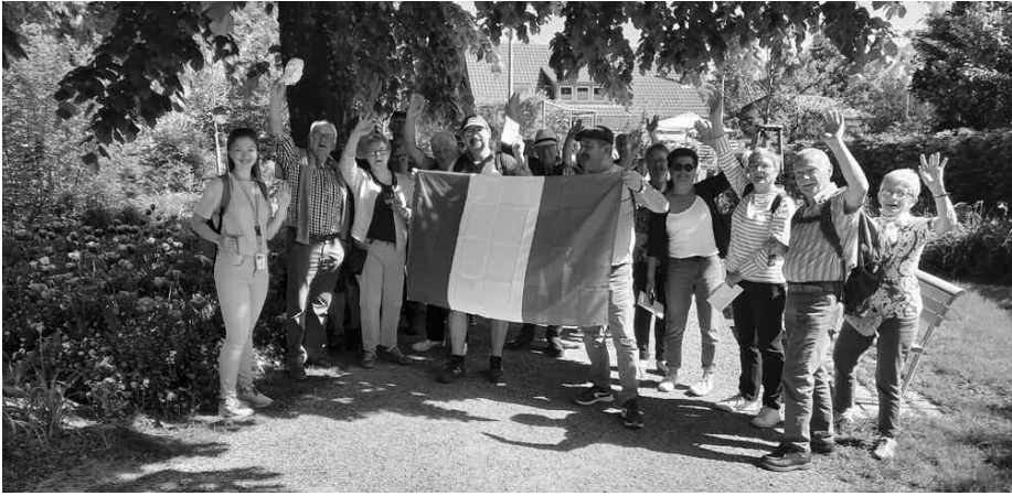
Französische Gruppe auf der Landesgartenschau.

viele Besucher aus Aulendorf war klar, dass der Tag für die Ausstellung zu kurz war und dass sie in den kommenden Wochen einen weiteren Besuch planen werden.