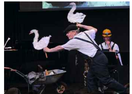
Szenenfoto © mini.musik e.V.

Das Familienticket gilt für bis zu zwei Erwachsenen mit bis zu fünf Kindern und ist in der Tourist Information Ravensburg buchbar. Die Familiengutscheine der Stadt Ravensburg können für diese Veranstaltung in der Tourist Information Ravensburg eingelöst werden.