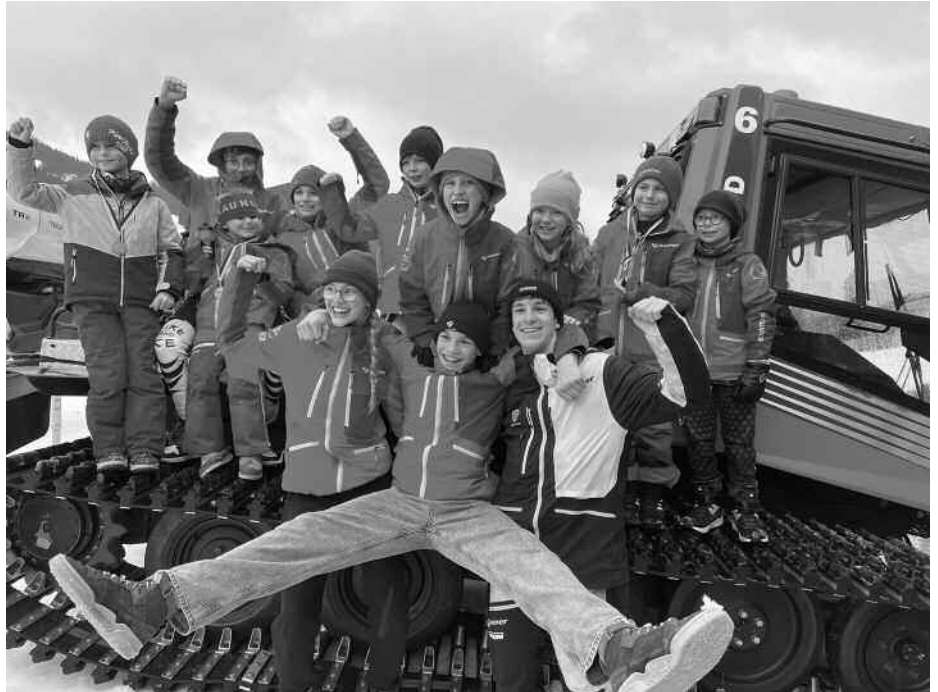
Die jubelnden Kinder der drei Schulen

werteten Rennläufer mit 1,19 Sekunden vorne war.