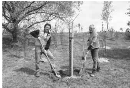
Baum pflanzen

Aktuelle Infos unter www.bund-aulendorf.de