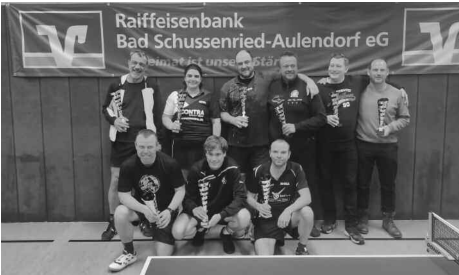
Fotos: Sieger Teams vom Samstag und Sonntag