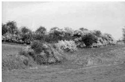
Naturhecke im Frühjahr; Foto: Gerhard Thielcke, BUND BW

Aktuelle Infos unter www.bund-aulendorf.de