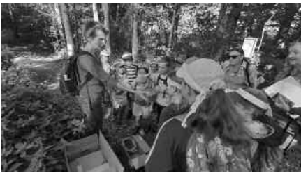
Kindergruppe mit dem BUND erforscht die Natur um den Steeger See, Foto: Bruno Sing

Hat Ihr Kind Interesse an Tieren, Wald und Natur rund um Aulendorf? Dann sind Sie richtig bei der Naturkindergruppe „Storchenbeobachter“ des BUND. Die Kindergruppe trifft sich einmal pro Monat, jeweils an einem Samstag. Wir freuen uns auf weitere naturbegeisterte Kinder im Alter von 5 bis 11 Jahren.