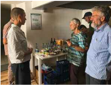
„Fair“kostung im Cineclub5