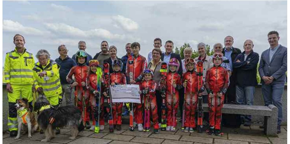
Begünstigte Vereine der Förderausschüttung 2022

Anträge müssen mit den im Vordruck geforderten Unterlagen bis spätestens 30. Oktober 2023 bei der Geschäftsstelle, Hauptstraße 35, 88326 Aulendorf eingereicht werden . Förderanträge können auf der Homepage der Bürgerstiftung Aulendorf heruntergeladen werden https://www.buergerstiftung-aulendorf.de/projekte-