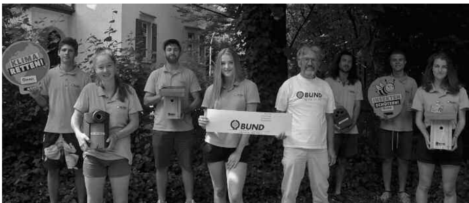
Die junge Leuten mit dem BUND-Vorsitzenden Bruno Sing starten Unterstützungsaktion für die Natur in und um Aulendorf.

Der BUND erhofft sich, dass sich viele Bürger Aulendorf für die aktive Unterstützung des Natur- und Umweltschutzes begeistern lassen, damit der BUND auch in Zukunft unabhängig von Stadt, Staat und Wirtschaft agieren kann.