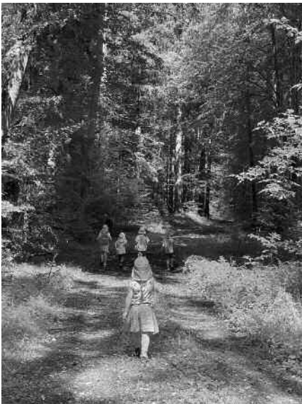
Gemeinsam den Wald und dessen Naturschätze macht am meisten Spaß.

Das Familienangebot findet im Rahmen des diesjährigen Altdorfer Wald Exkursionsprogramms statt, dass der BUND Ravensburg-Weingarten in Kooperation mit ForstBW und dem Verein Altdorfer Wald e.V. nun bereits im dritten Jahr anbietet. Weitere Termine unter: www.bund-ravensburg.de/service/termine