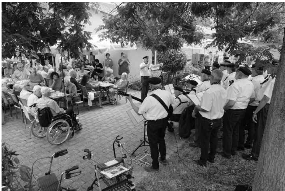
Mit „La Paloma“ und „Kurs auf Nord“ unterhielt der Marinechor Aulendorf die Gäste beim Sommerfest im Garten des Wohnparks Martinus.

„Den Anker gelichtet“ und „Kurs auf Nord“: Der Marinechor Aulendorf hat