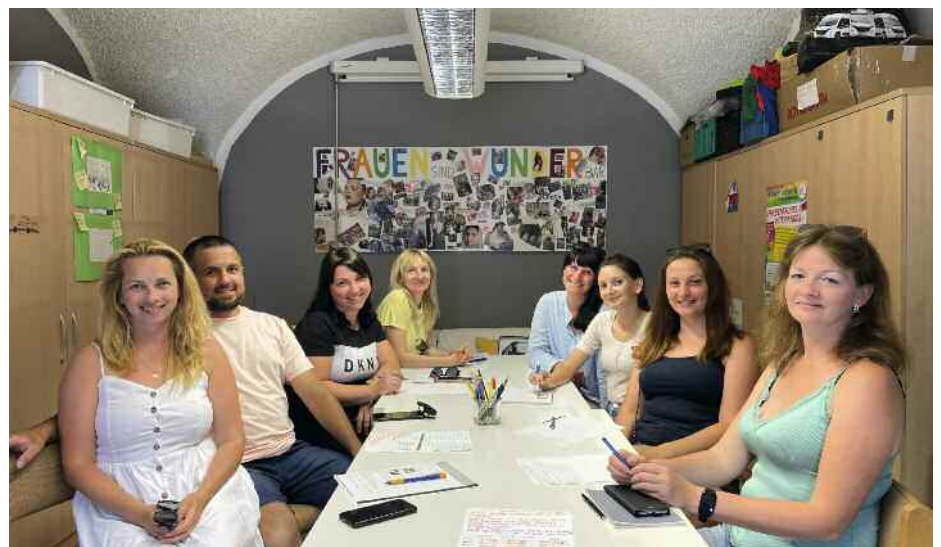
Eltern der Kinder und Jugendliche im Multikulti-Hangout/ Jordan Daganato

Der Hangout wird auch durch die Kooperati-