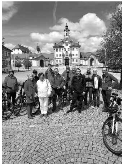
Auch in Altshausen waren die Roten Radler*innen schon.

Nähere Infos hierzu finden sich auf unserer Homepage, www.aulendorf-spd.de .