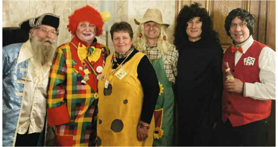
Die BUS-Fraktion bei der "Gemeinderatssitzung" im Marmorsaal

Das 1x1 der Schuh-Pflege Kurs-Nr. 231-11606