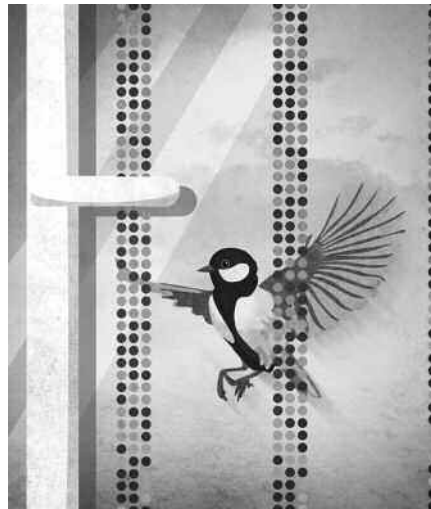
Markierungen gegen den Vogelschlag (Ann-Kathrin Hahn / Das Illustrat)

Kollisionen mit Glas sind eine der größten Gefahren für Vögel. Über 18 Millionen verunglücken jedes Jahr in Deutschland an Fenstern, Glasfassaden Glas-Bushaltestellen und Wintergärten. Dabei gibt es wirksame Abhilfe.