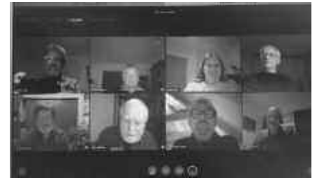
Ein digitales BUND-Treffen per Videokonferenz