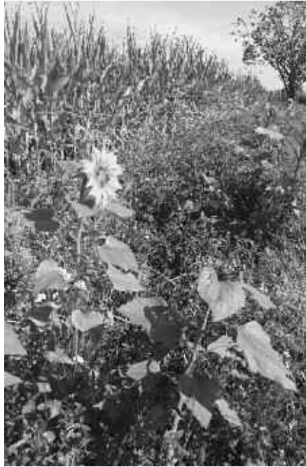
Blühstreifen in Schlier 2021

Auch dieses Jahr war das „Projekt Ackerblühstreifen“ ein voller Erfolg. Das Gemeinschaftsprojekt des Landschaftserhaltungsverbandes Ravensburg (LEV) und dem Bauernverband Allgäu-Oberschwaben e.V. konnte auch dieses Jahr auf ein Neues viele Insekten und Vögel erfreuen. Im 4. Jahr des Projektes haben sich wieder ca. 110 landwirtschaftliche Betriebe beteiligt und Teile ihres Ackers mit Blühstreifen versehen. Dieses Jahr kam auch neu die Fahrgassenmischung für den Obstbau hinzu. Wir danken der Kreissparkasse Ravensburg die finanzielle Unterstützung, durch die die Kosten des Saatgutes gedeckt werden können. Kräuterreiche Blühstreifen leisten einen Beitrag, die Biodiversität in der Landschaft zu erhöhen und das Landschaftsbild aufzuwerten. Blumen, wie Klee, Malve, Mohn, Kornblume und Lein liefern Pollen und Nektar für zahlreiche Insekten sowie Sämereien für Vögel. Die bunten Blühstreifen vernetzen Lebensräume und erfreuen auch Spaziergänger. Liegen sie idealerweise zwischen zwei Ackerschlägen, bieten sie Brutmöglichkeiten und Nahrung für bodenbrütende Vogelarten,