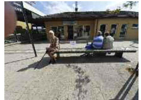
Schwätzlesbank am Bahnhof

Kontakt: stadtseniorenrat@aulendorf.de (07525) 934-177