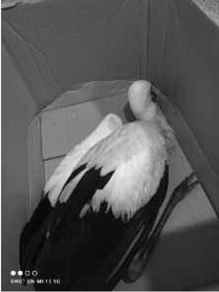
Verletzter und erschöpfter Jungstorch wurde zum Tierarzt gefahren.

von Mössingen aus ins Winterquartier fliegen.