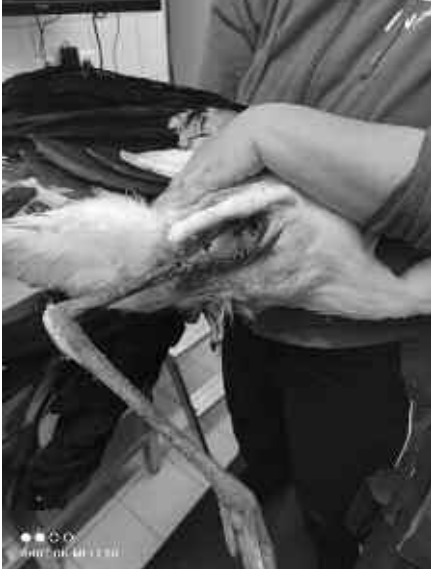
Der Jungvogel nach der Operation des Oberschenkel.