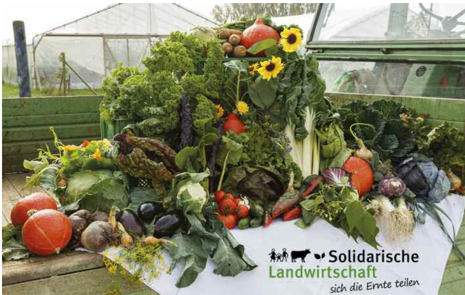
Auch dieses Jahr hatte die SoLawi-Ravensburg einen reich gedeckten Erntedank-Tisch, der an die Tafel Ravensburg gespendet wird.