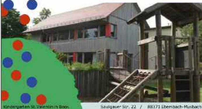
Kindergarten St. Valentin in Boos

Dann schicke uns Deine Bewerbung bis zum 16.05.2021 an info@ebersbach-musbach.de . Bei Fragen melde Dich gerne auch telefonisch unter 07584-9212-11.